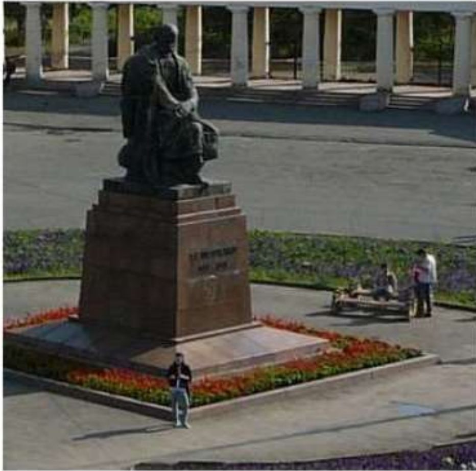
Пам'ятник у місті Орську (Росія), де Шевченко перебував на засланні в 1847 - 1848 роках, встановлений на площі, яка носить його ім'я. Встановлений у 1959 році.