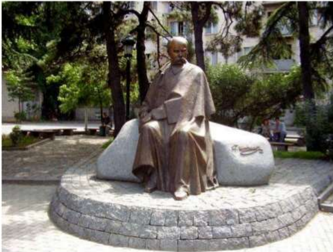
Тбілісі (Грузія). Пам'ятник відкрито 2 березня 2007 року.