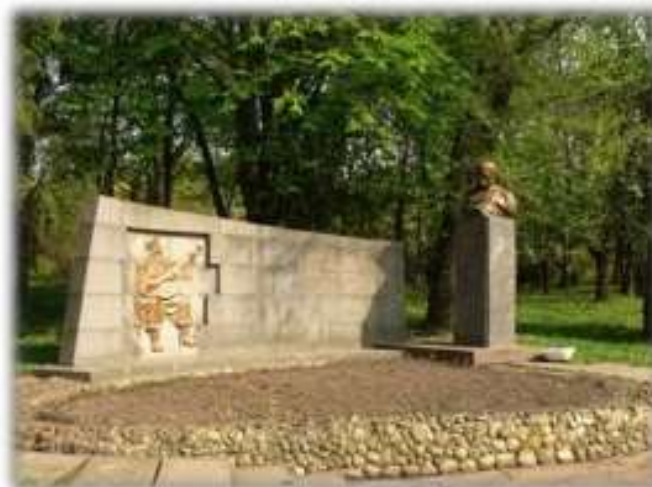
Місто Рівне, парк ім. Т.Шевченка