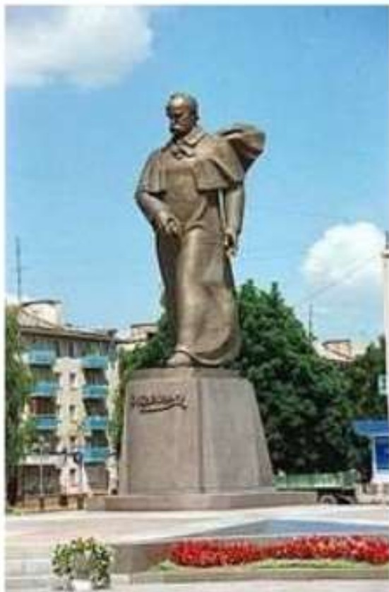
Місто Рівне, майдан Незалежності