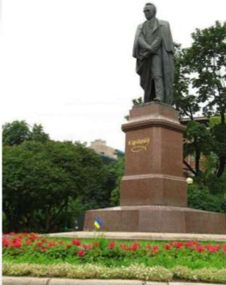
Пам'ятник Тарасу Шевченку в Санкт-Петербурзі на майдані Шевченка